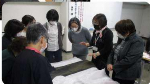
【協働】生涯学習プランナー「実生の会」歴史班